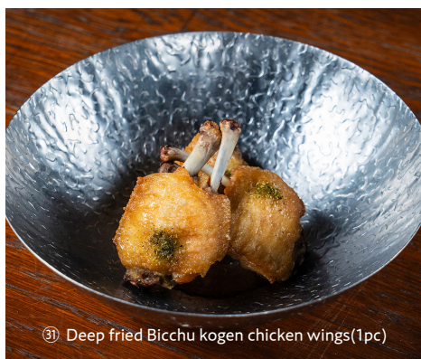
③① Deep fried Bicchu kogen chicken wings (1pc)