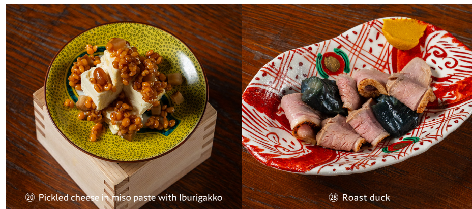
㉒ Pickled cheese in miso paste with Iburigakko