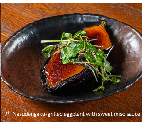
③② Nasudengaku-grilled eggplant with sweet miso sauce