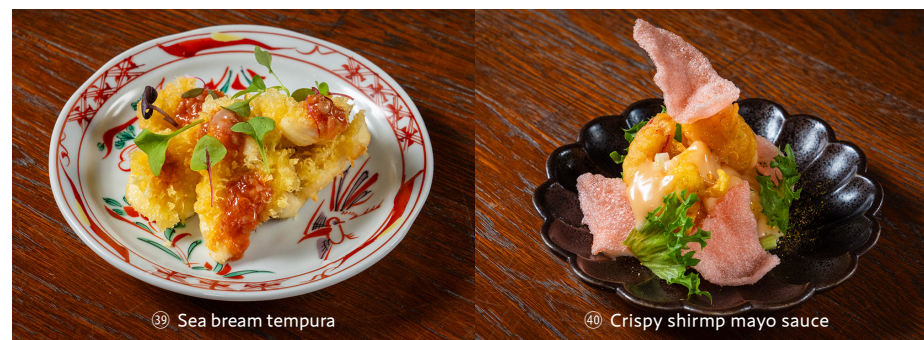
③⑨ Sea bream tempura